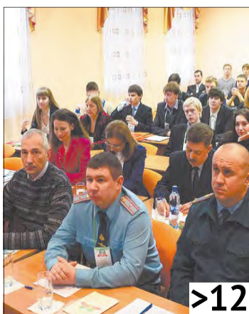
>12 Подведены итоги республиканской конференции